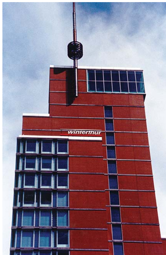
Corporate Head Office von Winterthur Life & Pensions in Winterthur.

Das Lebensversicherungsgeschäft dagegen ist anders. »Zwischen Vertragsabschluss und Vertragsende liegen im Schnitt 20 bis 30 Jahre, doch niemand kann vorhersagen, ob eine Lebensversicherung wie geplant am Ende der vereinbarten Laufzeit ausbezahlt werden kann oder ob vorher ein Versicherungsfall eintritt«, so